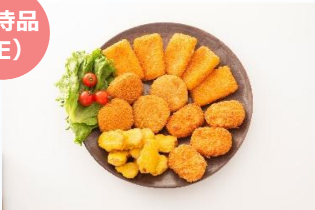
東平屋まんぞくセット