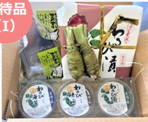
わさび詰め合わせ