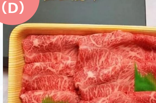
箱根西麓牛詰め合わせ