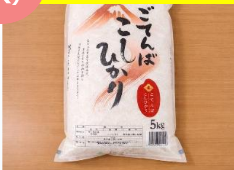
ごてんばこしひかり