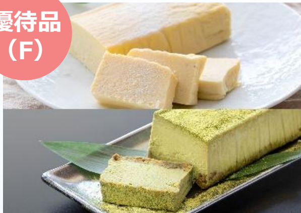
静岡県産抹茶&テリーヌフロマージュの チーズケーキセット