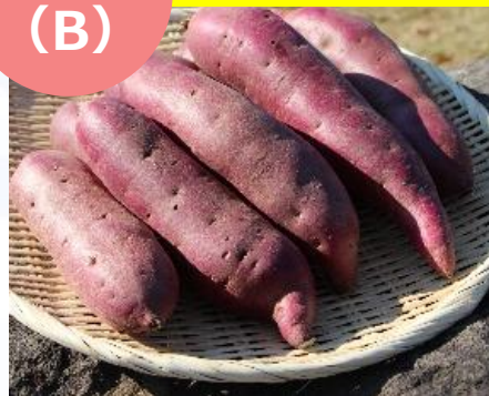
三島甘露「紅あずま」