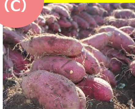
三島甘露「紅はるか」