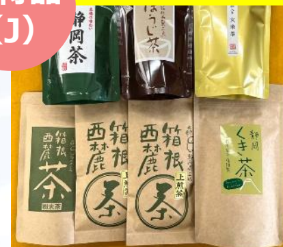
箱根西麓茶詰め合わせ