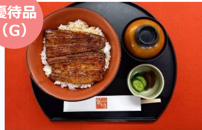
うなぎの蒲焼き (1人前)