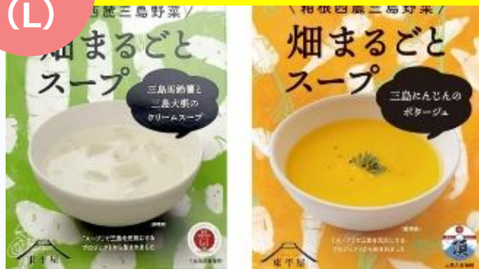
東平屋スープとゼリーの乾物セット