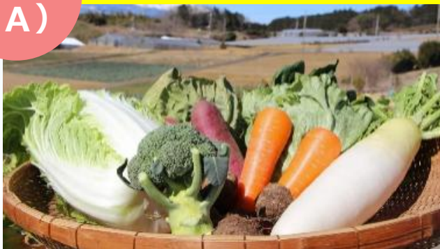
箱根西麓三島の野菜詰め合わせ