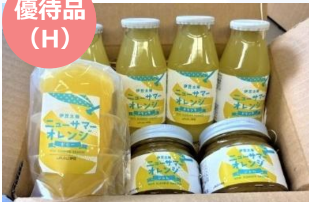
ニューサマーオレンジ加工品詰め合わせ