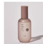
Lotion (ローション) 100ml

スキンケア3点セットのお申込みは、1セットにつき優待券 (3,000円) 2枚 で適用可能