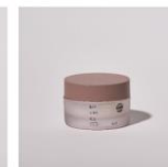
Gel (ジェル) 50g