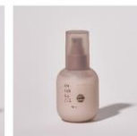
Milk (ミルク) 100ml