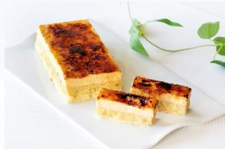
優待品（C） 三島甘藷を使用したさつまいもの カタラーナ （販売元：みしまプラザホテル）