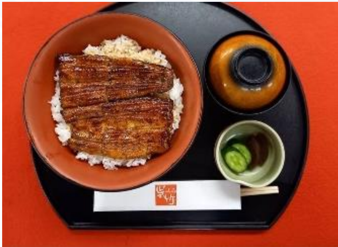
優待品（F） うなぎの蒲焼き 1人前 （販売元：割烹 呉竹） ※うなぎのみのご提供となります。