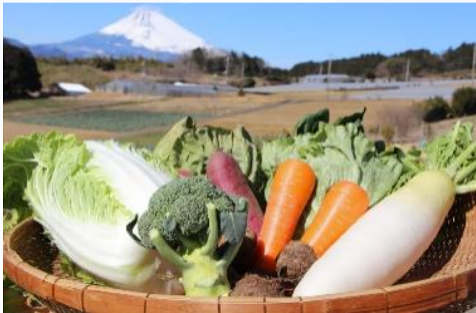
優待品（A） 箱根西麓三島の野菜詰め合わせ （販売元：JAふじ伊豆） ※野菜の種類はお任せとさせていただきます。