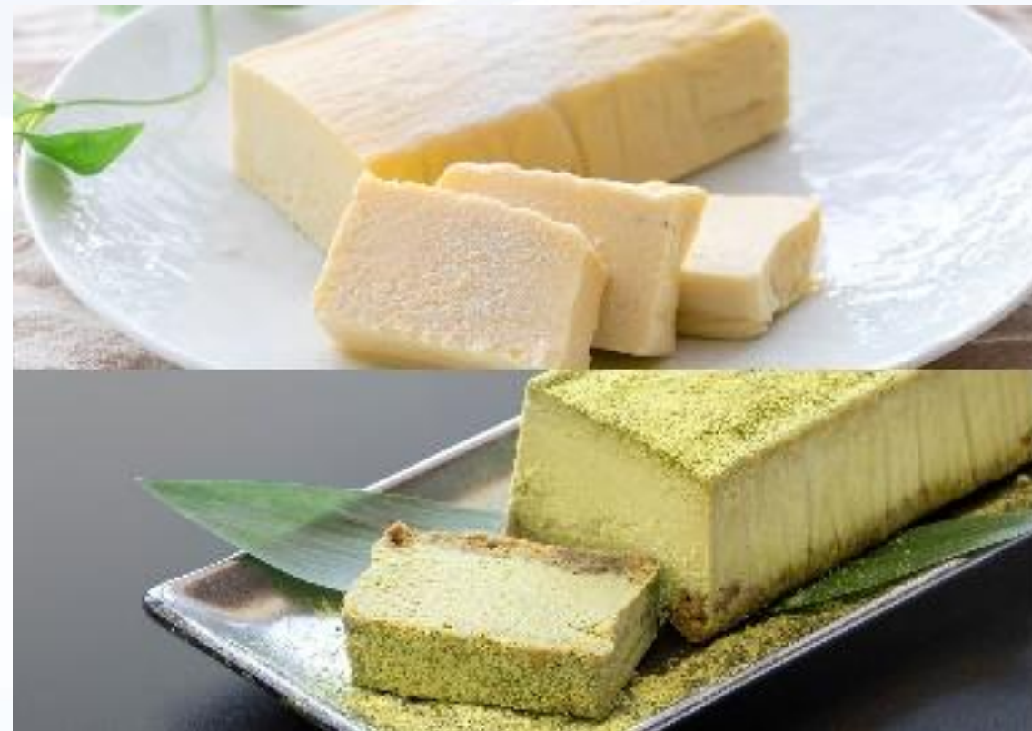
優待品（G） 静岡県産抹茶&テリーヌフロマージュのチーズ ケーキセット （販売元：みしまプラザホテル）