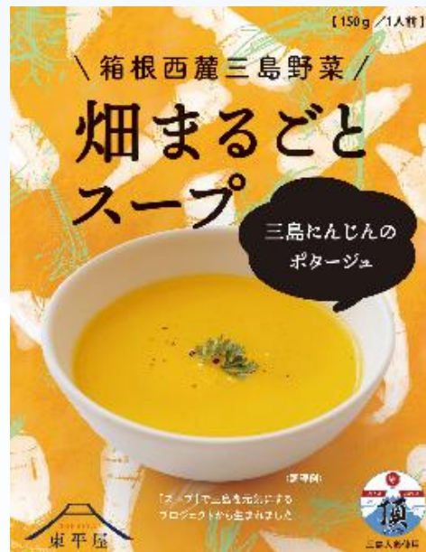
優待品（B） 箱根西麓三島野菜 畑まるごとスープ （販売元：東平屋）