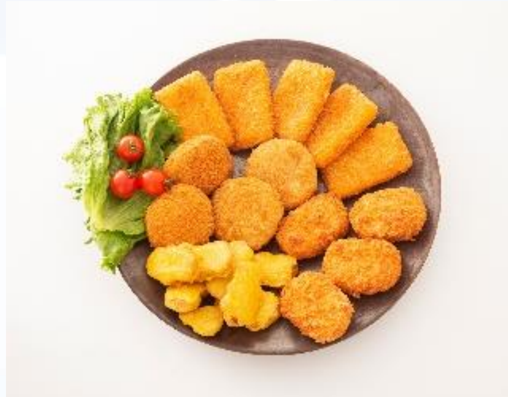
優待品（E） 東平屋まんぞくセット （販売元：東平屋）