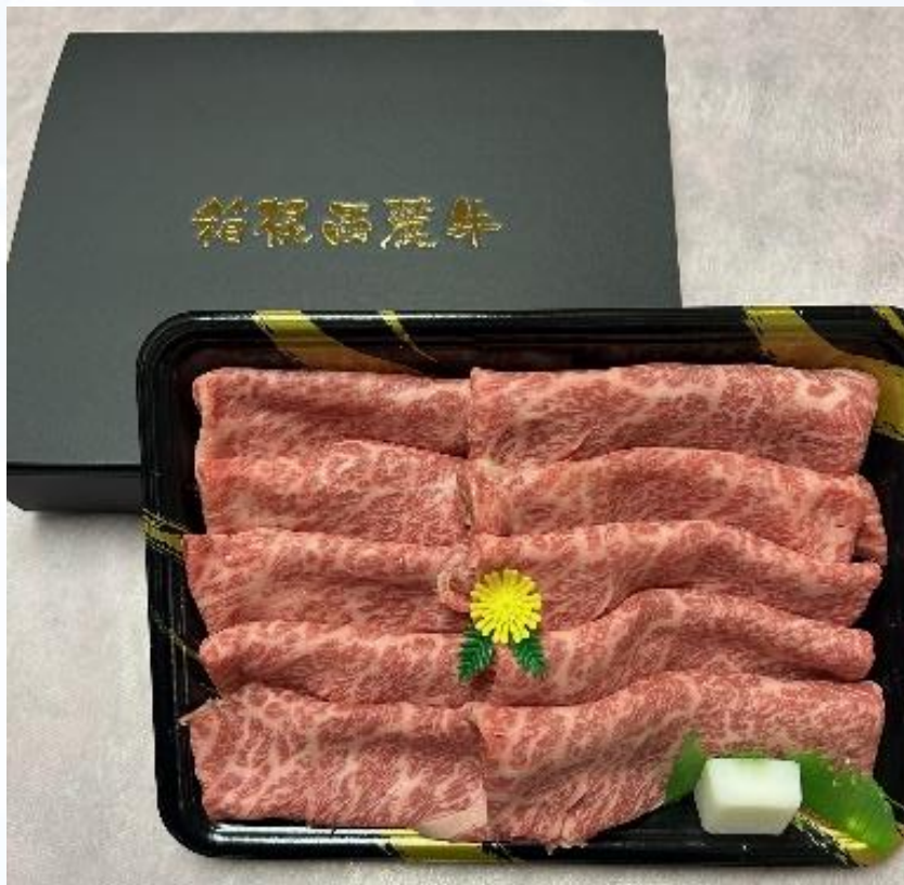
優待品（D） 箱根西麓牛詰め合わせ （販売元：JAふじ伊豆）