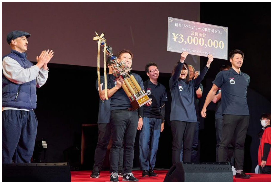
FC加盟店全国大会 福祉リベンジャーズ（2022年）